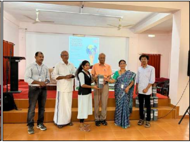
Distribution of Rain Gauges to the CLAP members of Bhoomithrasena Club